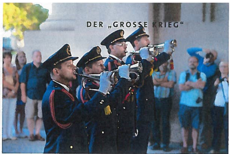
In Ypern wird jeden Abend punkt 20.00 Uhr die „Last Post“ geblasen.

Zusammenhang unbedingt gesehen haben muss man in Ypern das „In Flanders Fields Museum“. Außerdem wird seit 1928 im Ehrenmal Menenpoort in Ypern jeden (!) Abend punkt 20.00 Uhr die „Last Post“ geblasen, ein unvergessliches Erlebnis!